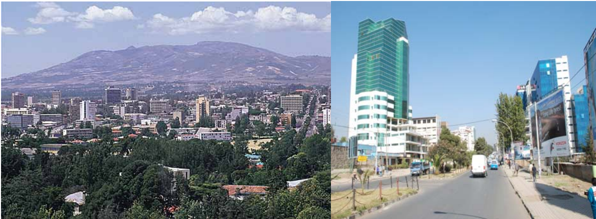
ሥዕል 4.8 የአዲስ አበባ ከተማ ከፊል ገጽታ

መስኮቶች ይኖሯቸዋል። ቀዝቃዛ የአየር ንብረት ባለባቸው አካባቢዎች የሚሠሩ ቤቶች ጣራ ዝቅ ያለና የመስኮቶቻቸው ብዛት አነስተኛ ነው።