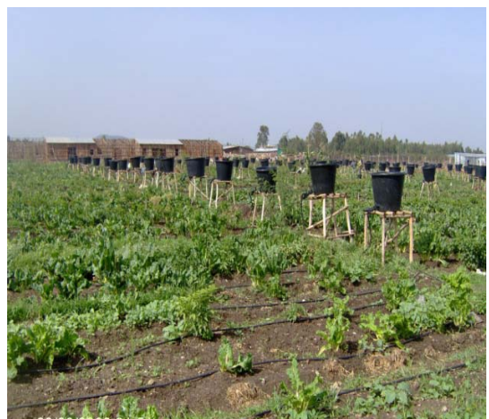
ሥዕል 4.13 የከተማ ግብርና በክፍል

በአዲስ አበባ ከተማ በሚገኙ በወንዞች ዳርቻዎችና በመኖሪያ ግቢ ውስጥም ልዩ ልዩ አትክልትና ፍራፍሬዎች ይመረታሉ። ጤፍ፣ ስንዴና ገብስ የመሳሰሉት የምግብ ሰብሎችም ይመረታሉ። በተጨማሪም የዶሮ እርባታ፣ የወተትና የሥጋ ከብት እርባታ፣ የአሳማ እርባታ፣ የእንጉዳይ ምርት፣ የሐር ትል ምርት፣ የንብ እርባታ፣ የችግኝ ማራቢያና የመሳሰሉት በሰፊው ይከናወናሉ።