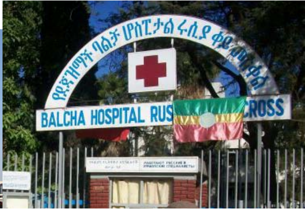
ሥዕል 4.12 በተለያዩ ክፍለ ከተሞች የሚገኙ ተቋማት

በሁሉም ክፍለ ከተሞች የተለያዩ ተግባራትን የሚያከናውኑ ተቋማት ይገኛሉ። ለምሳሌ፦