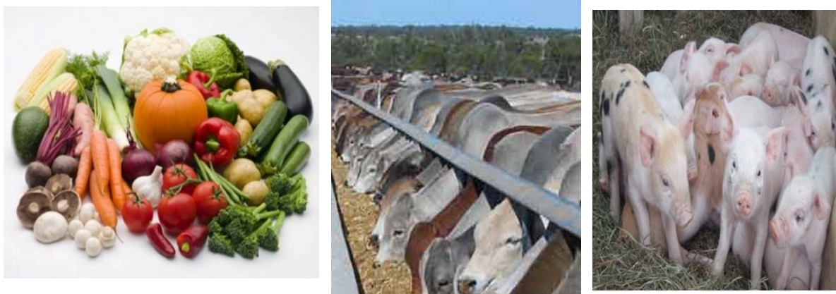
ሥዕል 4.14 የከተማ ገብርና እንቅስቃሴ በከፊል