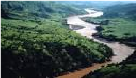
ሥዕል 4.6 ዝቅተኛ ቦታዎች