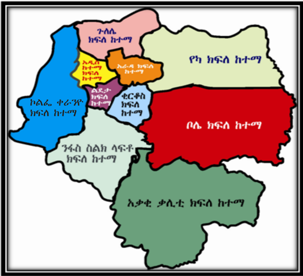
ምዕራ 4.2 የአዲስ አበባ ክፍለ ከተሞች ንደፍ ካርታ