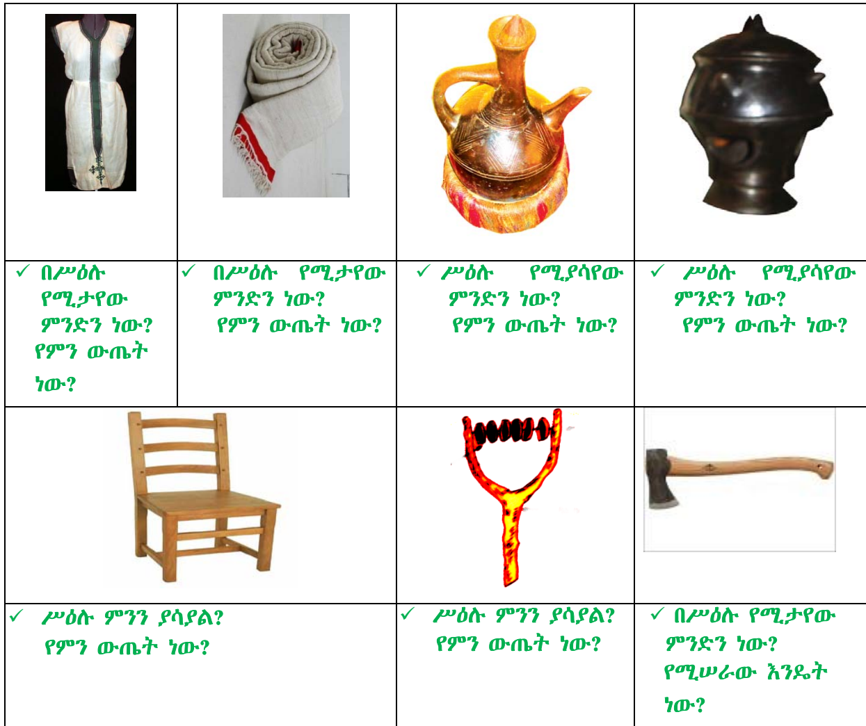
ሥዕል 4.17 ልዩ ልዩ የእደጥበብ ወጤቶች

የእደ ጥበብ ወጤቶች በተለያዩ ዘዴ ሊሠሩ ወይንም ሊመረቱ ይችላሉ። ለምሳሌ ሰዎች በእጃቸው ወይንም ትንንሽ የማምረቻ መሣሪያዎችን በመጠቀም እቃዎችን ያመርታሉ። የሀገር ባህል ልብሶች፣ የሸክላ ምጣድ፣ ጀቦና፣ የአበባ ማስቀመጫ የመሳሰሉት እቃዎችን በእጅ ይሠራሉ። በተለያዩ የከተማችን አካባቢዎች በርካታ የእደ ጥበብ ወጤቶች ይመረታሉ። በጉለሌ ክፍለ ከተማ በሚገኙ በሽሮ ሜዳና በቀጨኔ አካባቢዎች የሸማ ልብስ በስፋት ይመረታል። የሸክላ ወጤቶች ደግሞ በቀጨኔ አካባቢ ይመረታሉ።