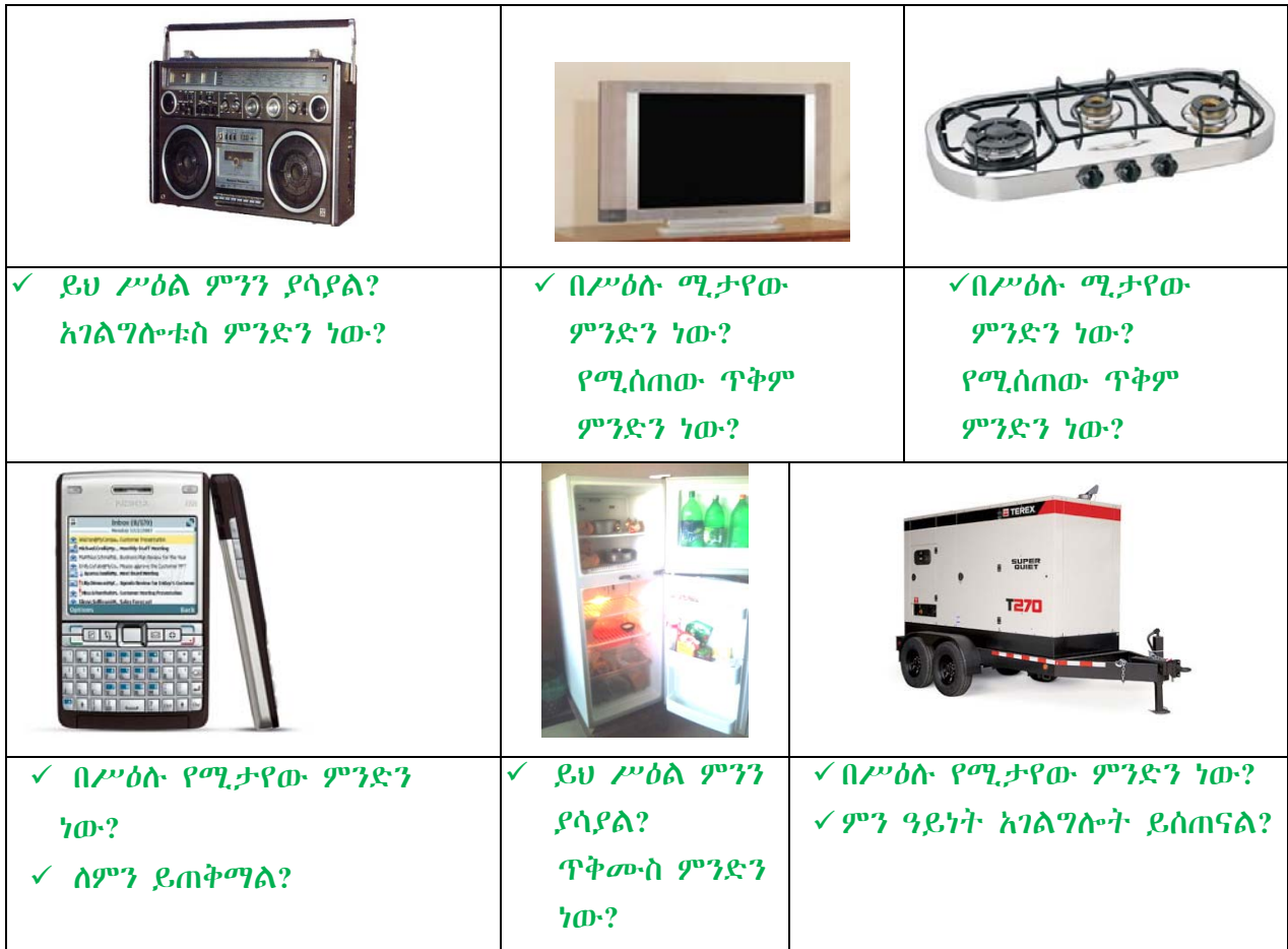
ሥዕል 4.18 የተለያዩ የቴክኖሎጂ ወጤቶች

የቴክኖሎጂ ወጤቶች የተለያዩ ጠቃሚ አገልግሎቶች በመስጠት አኗኗራችን ቀላልና ምቹ እንዲሆን ይረዱናል።