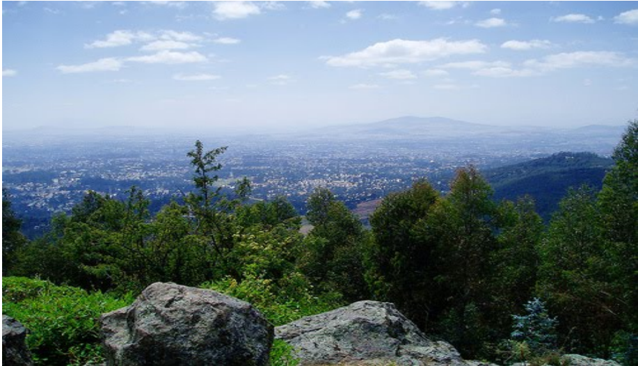
ሥዕል 4.5 የእንጦጦ ክፍተኛ ቦታ