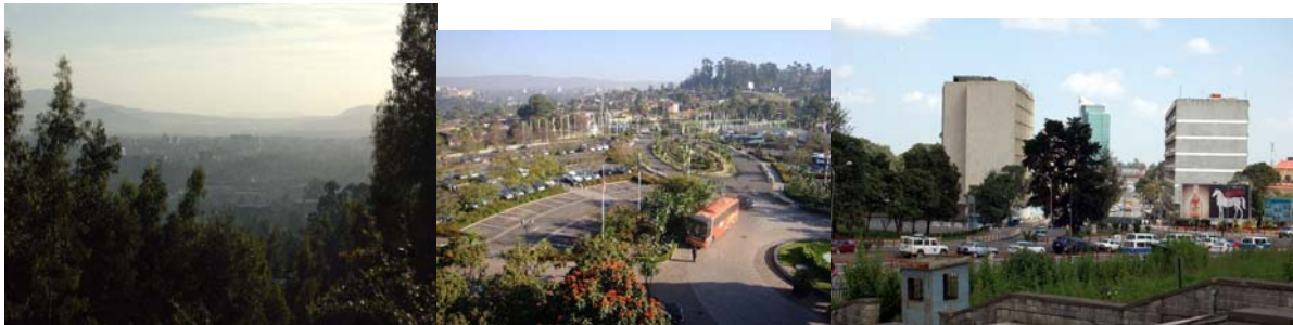
ምዕራፍ 4.4 በተለያዩ ክፍለ ከተሞች የሚገኙ የመሬት ገጽታዎች

የመሬት ገጽታ በአንድ አካባቢ የሚገኝ የመሬት ተፈጥሮአዊ አቀማመጥ ነው። በአዲስ አበባ ከተማ በሚገኙ ክፍለ ከተሞች የተለያዩ የተፈጥሮ ገጽታዎች ይገኛሉ። በከተማው