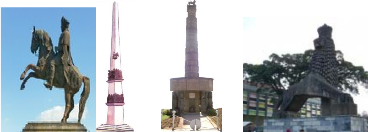
ሥዕል 4.3 በተለያዩ ክፍለ ከተሞች የሚገኙ ሐውልቶች