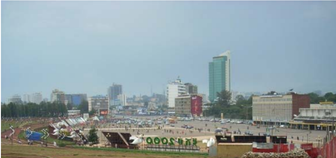
ሥዕል 4.7 ሜዳማ አካባቢ