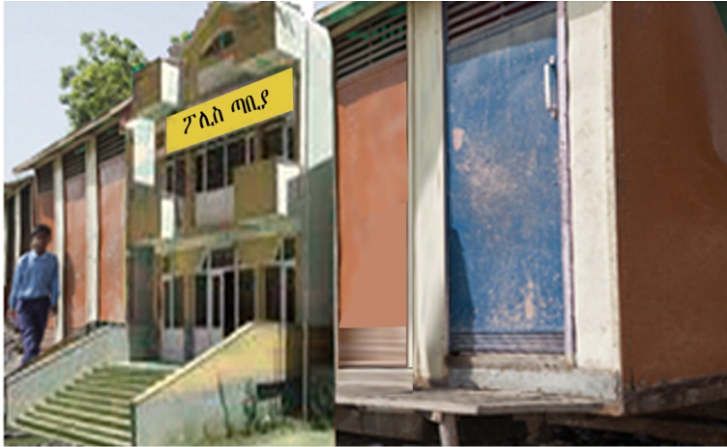
ሥዕል 4.10 ፖሊስ ጣቢያ

ፍርድ ቤቶች፡- በክፍለ ከተማችን የተለያዩ ምድብ ያላቸው ፍርድ ቤቶች ሊገኙ ይችላሉ። ፍርድ ቤቶች የኅብረተሰብ ሰላም ተጠብቆ የዕለት ተዕለት ተግባራት እንዳይደናቀቁ የሚሠሩ መንግሥታዊ ተቋማት ናቸው። ፍርድ ቤቶችም ሕግን በመተርጎም ሕገ ወጥ በሆኑ ግለሰቦችና ድርጅቶች ላይ ተገቢ እርምጃ እንዲወስዱ የተበደሉ ዜጎች መብታቸው እንዲከበርላቸው የሚሠሩ ተቋማት ናቸው።