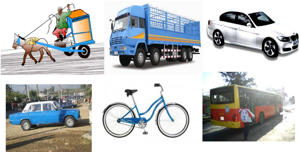
ሥዕል 4.16 የየብስ መጓጓዣ ዓይነቶች