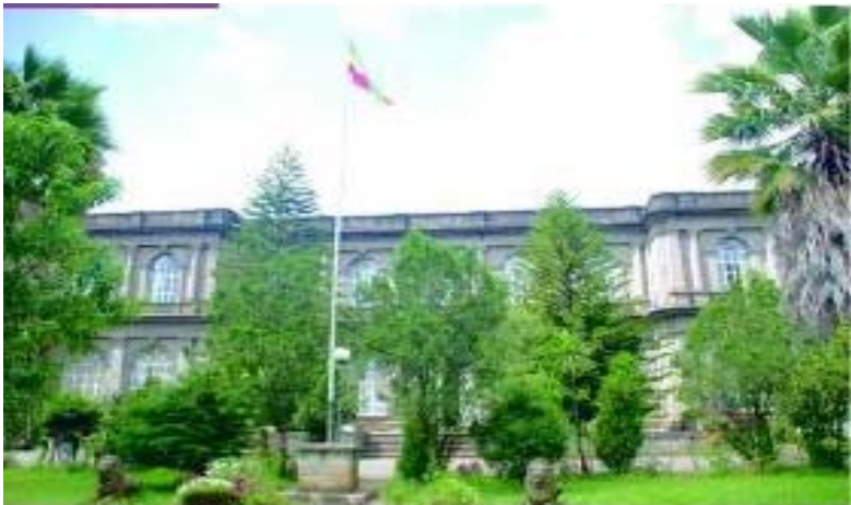
ሥዕል 4.11 የፌደራል ጠቅላይ ፍርድ ቤት

ፍርድ ቤቶች፡- በክፍለ ከተማችን የተለያዩ ምድብ ያላቸው ፍርድ ቤቶች ሊገኙ ይችላሉ። ፍርድ ቤቶች የኅብረተሰብ ሰላም ተጠብቆ የዕለት ተዕለት ተግባራት እንዳይደናቀቁ የሚሠሩ መንግሥታዊ ተቋማት ናቸው። ፍርድ ቤቶችም ሕግን በመተርጎም ሕገ ወጥ በሆኑ ግለሰቦችና ድርጅቶች ላይ ተገቢ እርምጃ እንዲወስዱ የተበደሉ ዜጎች መብታቸው እንዲከበርላቸው የሚሠሩ ተቋማት ናቸው።